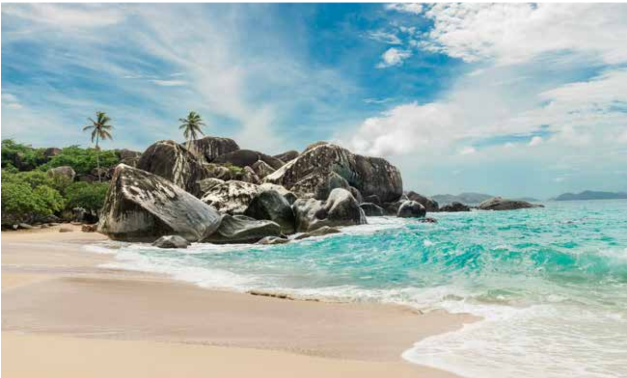
British Virgin Islands Tourism

ENCHEVÊTREMENT D'IMPOSANTS BLOCS DE GRANIT, THE BATHS EST L'UN DES SITES LES PLUS EMBLÉMATIQUES DES ÎLES VIERGES BRITANNIQUES. UNE ESCALE À NE PAS MANQUER SUR L'ÎLE DE VIRGIN GORDA.