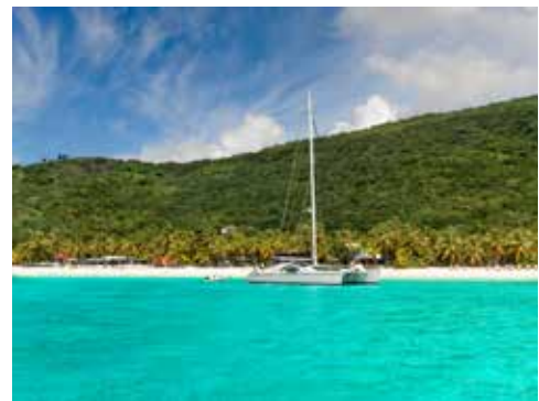
British Virgin Islands Tourism

Il nous reste une dernière journée avant de rendre le bateau à Saint-Martin. Nous décidons de la passer à Dog Island, une petite île déserte située à une dizaine de milles au large de Road Bay, uniquement colonisée par de très nombreux oiseaux marins qui y trouvent un refuge pour nidifier. Aucun voilier en vue lorsqu'on nous approchons du seul mouillage de l'île (Great Bay). La plage est splendide et, surprise, nous avons une ultime possibilité de kiter sur une « piscine ». C'est le cinquième spot que nous découvrons durant la croisière, et pas le moins attrayant... À terre, la balade est magnifique. Dog Island constitue un bonus pour le moins inattendu venant ponctuer une croisière magique aux îles Vierges britanniques, ce genre d'endroit qu'on quitte en sachant qu'on y reviendra.