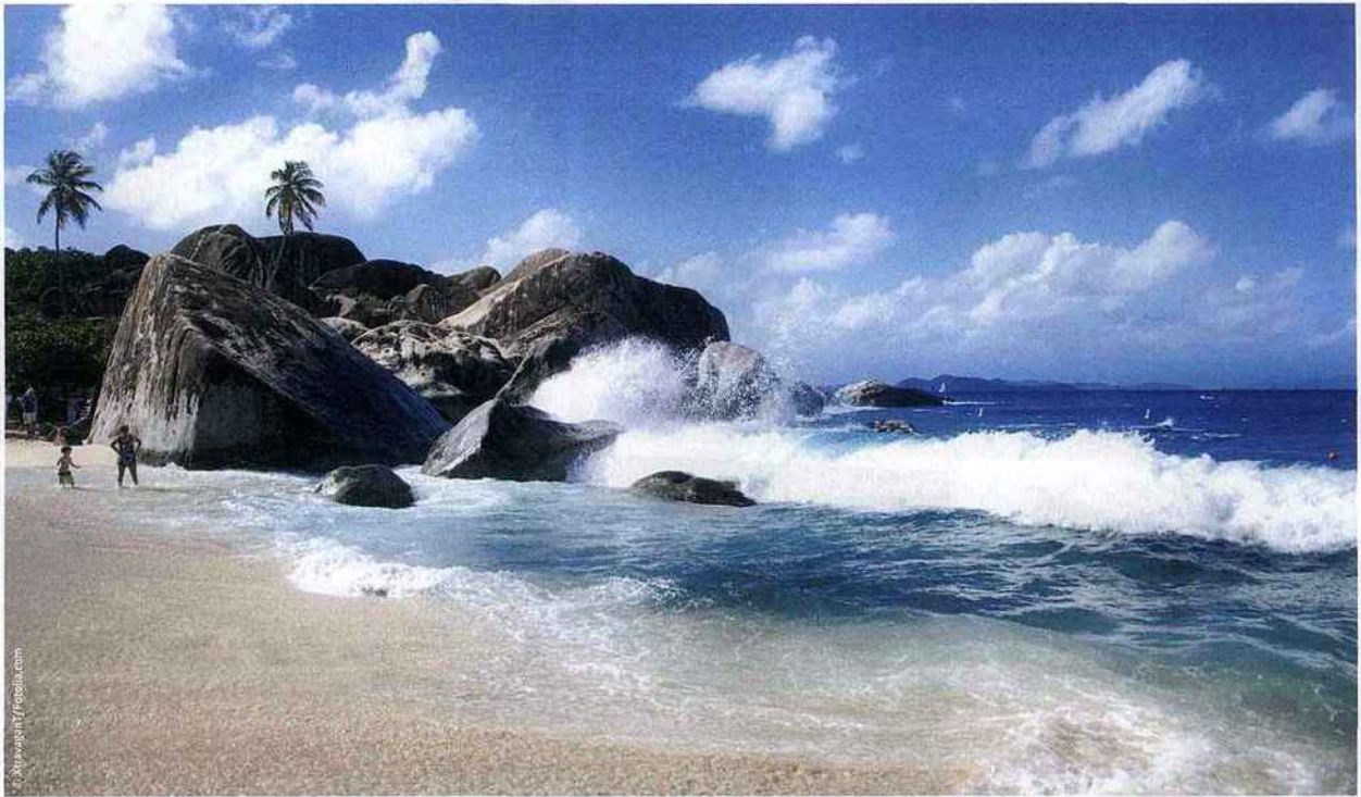
Classé parc national, le site des Baths, à Virgin Gorda, est l'un des lieux les plus touristiques de l'archipel. Les visiteurs y découvrent un amoncellement de blocs de granit, certains pouvant atteindre 12 m de haut, formant un labyrinthe de grottes, piscines naturelles et criques intimes.